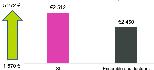
Salaire mensuel net médian, 1 an après la thèse

La moitié des diplômés d'un doctorat ont un salaire net mensuel supérieur à 2 512 € et l'autre moitié ont un salaire net mensuel inférieur à 2 512 €.